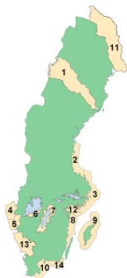
Figur 1 Karta över fiskeområden

Varje fiskeområde som etablerades bildade en fiskeområdesgrupp (FOG) som administrerade fiskeområdet. Två fiskeområden valde att ha en gemensam administration. Fiskeområdesgrupperna skulle vara sammansatta av personer från flera olika intressen med fokus på ett underifrånperspektiv vilket innebar att behov och projektidéer skulle vara lokalt förankrade. Grupperna tog fram egna utvecklingsstrategier och åtgärdsplaner för att inom varje fiskeområde kunna uppfylla målen för Hållbar utveckling av fiskeområden . Strategier och budget för respektive område beslutades av Fiskeriverket. Fiskeområdesgrupperna bedömde de ansökningar som kom in och valde ut och godkände de ansökningar som stämde överens med den utvecklingsstrategi som fanns för området.